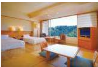
松韻閣 3F~6F 山側 (和洋室)

木の温もりをコンセプトにモダンテイストの和洋室タイプのお部屋は 四季の移り変わりを感じられる寛ぎの空間。 誰にも邪魔されることなく思いっきり羽を伸ばしゆったりと過ごす特別な一日を。