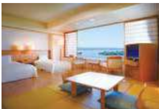
松韻閣 3F~6F 海側 (和洋室)