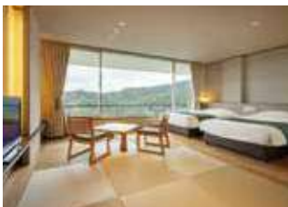
松韻閣 LF~7F 山側 (和洋室)

木の温もりをコンセプトにモダンテイストの和洋室タイプのお部屋は 四季の移り変わりを感じられる寛ぎの空間。 誰にも邪魔されることなく思いっきり羽を伸ばしゆったりと過ごす特別な一日を。