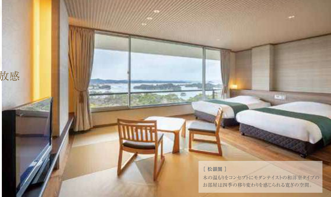
LF~7F 海側 (和洋室)

四季折々に美しい姿を見せる 雄大な松島の絶景。 心と体を解き放つ、プライベートな時間。 リゾートホテルならではの優雅な空間と 絶景で贅沢な時間をお約束します。