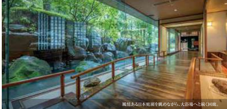
風情ある日本庭園を眺めながら、大浴場へと続く回廊。